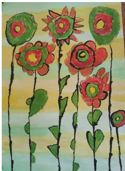
Zala Žižek, 1.A