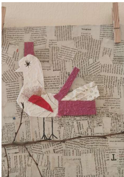
Lana Zemljak, 3.B

* Šolska shema šolskega sadja, zelenjave ter mleka in mlečnih izdelkov