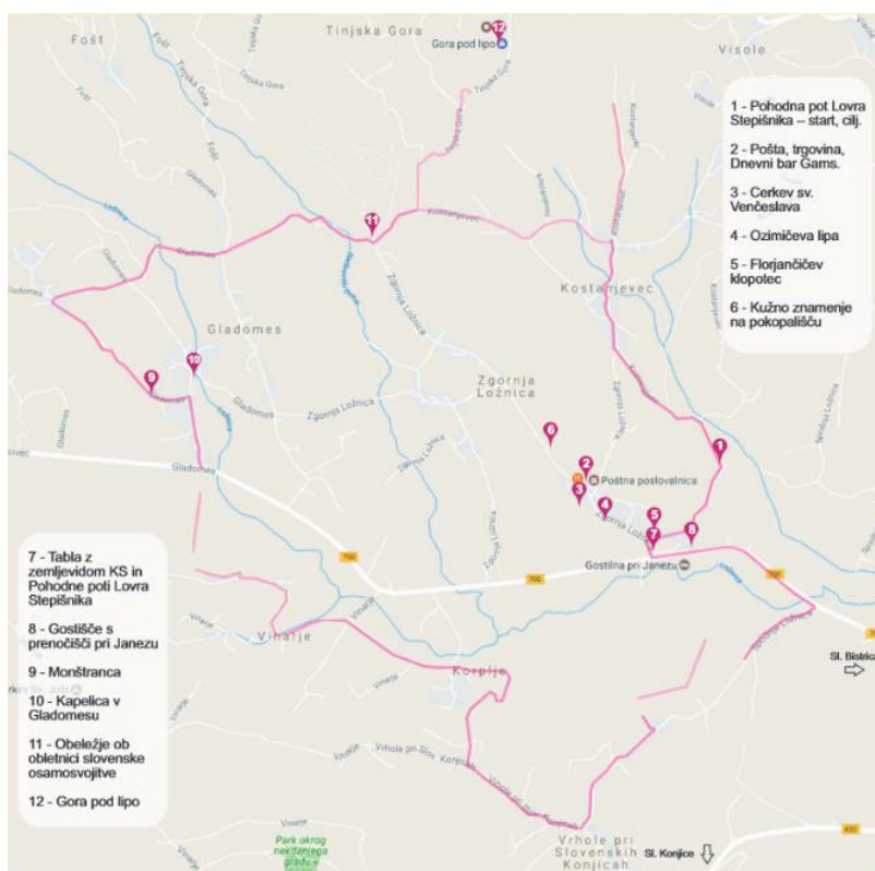
Slika 7: Zemljevid Stepišnikove pohodne poti.

Ob poti bomo postavili promocijske točke, na katerih se bodo predstavljali lokalni pridelovalci hrane, na voljo pa bo tudi Stepišnikova mal'ca. Vsak postanek bo priložnost za učenje, fotografiranje in okušanje lokalnih specialitet. Točke bodo popestrile tudi stare igrice našega kraja, skozi katere bodo obiskovalci spoznavali sestavine Stepišnikove mal'ce. Pohodniki se bodo lahko razdelili na manjše ekipe in sodelovali v igrah, ki se bodo odvijale tekom poti. Vsi iz zmagovalne ekipe bodo domov odnesli brezplačen paket Stepišnikove mal'ce.