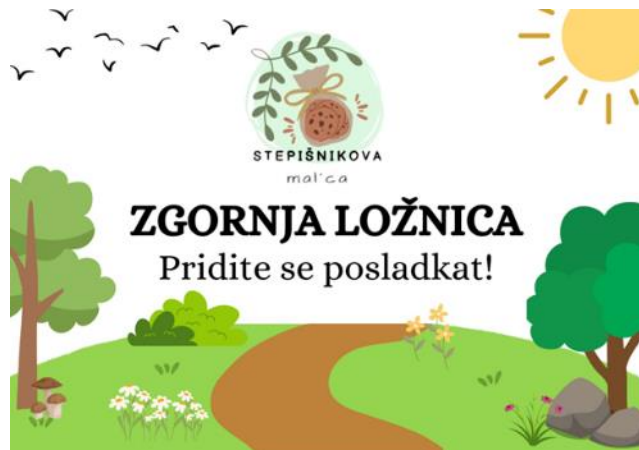
Slika 8: Letak za promocijo Zgornje Ložnice in Stepišnikove mal'ce.

Izdelale smo promocijski letak in promocijski plakat za naš dogodek.