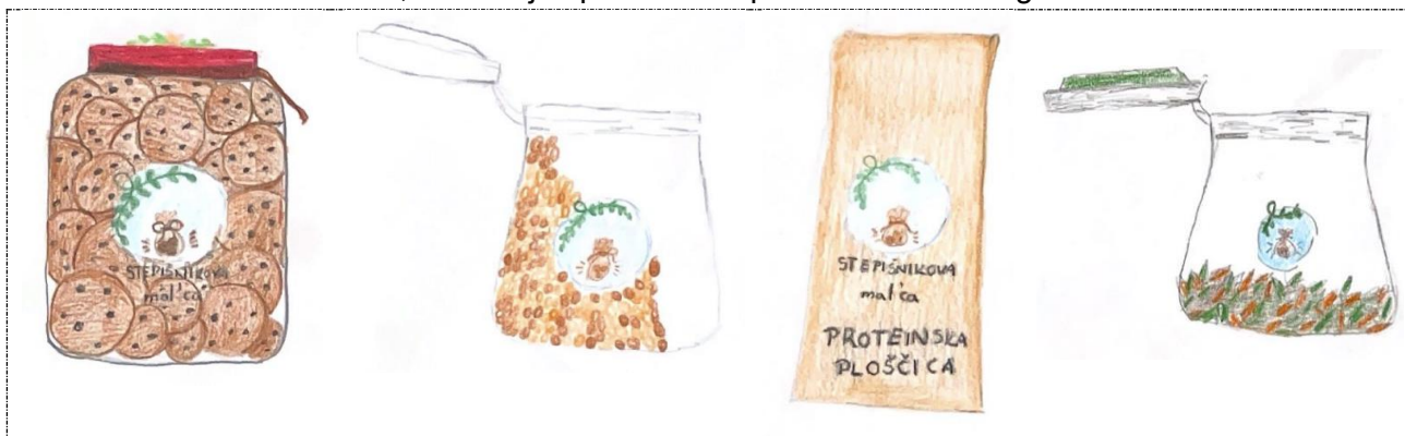
Slika 4: Stepišnikova mal'ca - piškoti, granola, granola ploščica in karamelizirana bučna semena (narisali Lina Pirš in Brina Kandut).

Naše izdelke smo skicirale, kako naj bi po naše Stepišnikova mal'ca izgledala.