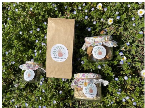
Slika 6: Izdelki Stepišnikove mal'ce.