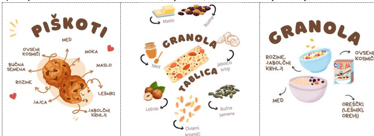
Slika 2. Izdelki in sestavine Stepišnikove mal'ce.

Zbrale smo nekaj idej, kaj vse bi lahko iz zgoraj predstavljenih sestavin naredili in ponudili za prodajo. Odločile smo se za več izdelkov, saj želimo, da lahko vsak najde nekaj zase.