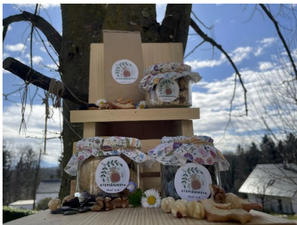
Slika 5: Izdelki Stepišnikove mal'ce.

Za potrebne materiale za pakiranje izdelkov bi poskrbeli na TD Zgornja Ložnica, ki bi priskrbelo etikete z logotipom in predlagano EKO-embalažo.