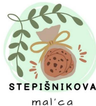
Slika 3: Logotip za znamko Stepišnikova mal'ca.

V naslednjem koraku smo izdelale nekaj logotipov za našo znamko turističnih spominkov. Logotip, ki ga bomo uporabile, smo izbrale z glasovanjem. Izbran je bil prvi, tisti z največ zelene barve. Ta logotip predstavlja zeleno naravo našega kraja in slastnost kulinaričnega spominka.