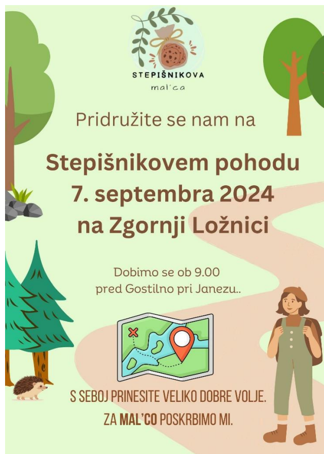
Slika 9: Promocijski plakat.

Naš dogodek bomo skupaj s TD Zgornja Ložnica oglaševale v: