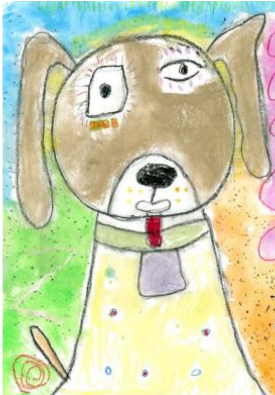
Zala Sernc, 2. b